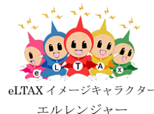
eLTAX イメージキャラクター エルレンジャー