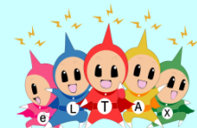
eLTAX イメージキャラクター エルレンジャー

●国税の電子申告・電子納税等については、 e-Tax ホームページ（ http://www.e-tax.nta.go.jp/ ）をご覧ください。